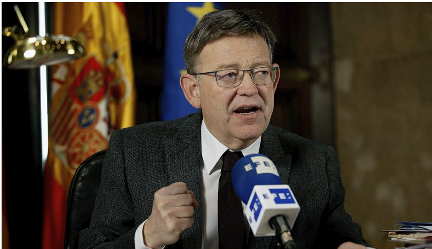
El president de la Generalitat, el socialista Ximo Puig

VALENCIA / El President de la Generalitat, Ximo Puig, ha reafirmado el compromiso de la Generalitat de ampliar las políticas destinadas a la reindustrialización de la Comunitat Valenciana y, en particular, aquellas relacionadas con la innovación.