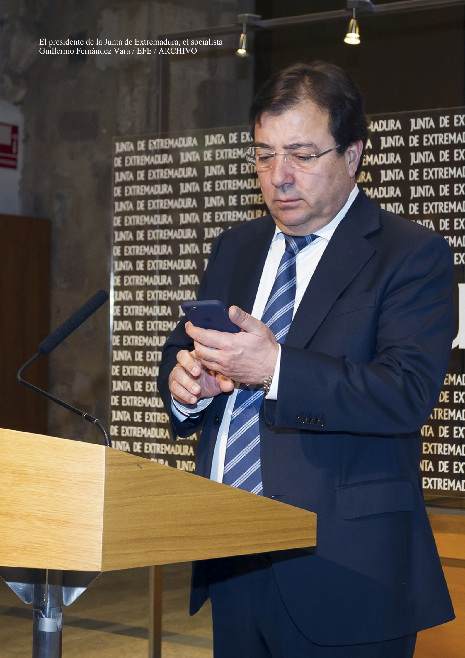
El presidente de la Junta de Extremadura, el socialista Guillermo Fernández Vara